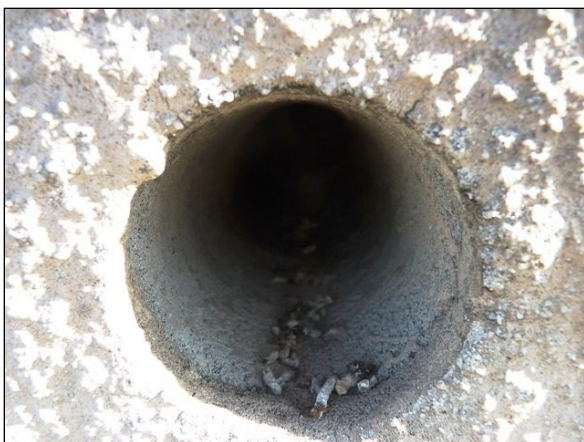
Trus drobných pěvců v ústí ventilačního otvoru