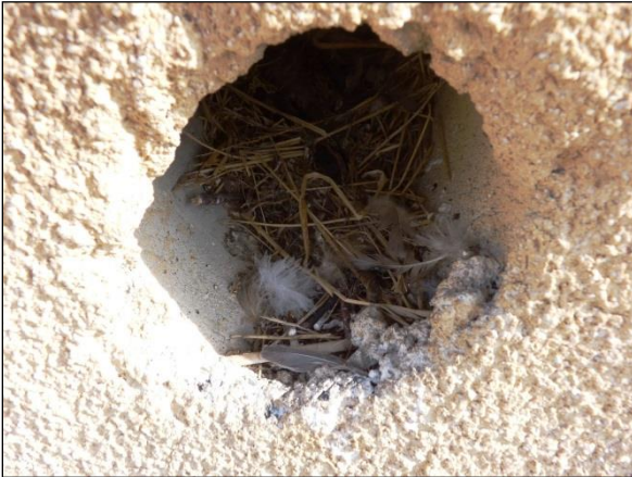
Hnízdní materiál, vypadávající z hnízda vrbců