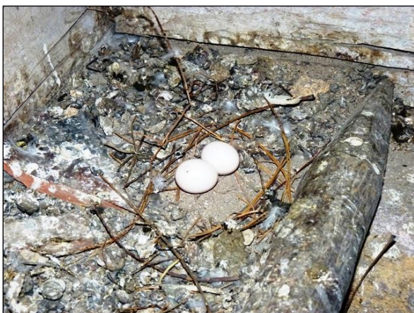
Hnízdo holuba věžáka je obvykle nedokončené