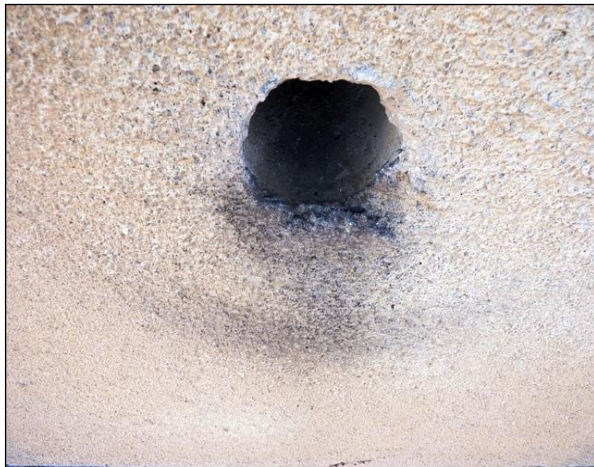
Znečištění fasády pod ventilačním otvorem, způsobené otěrem rýdovacích per pěvců