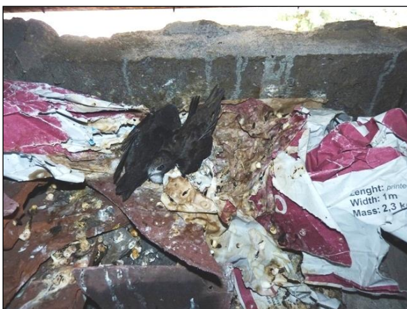
Rorýsi často hnízdo vůbec nestaví, spokojí se s materiálem, který v dutině naleznou