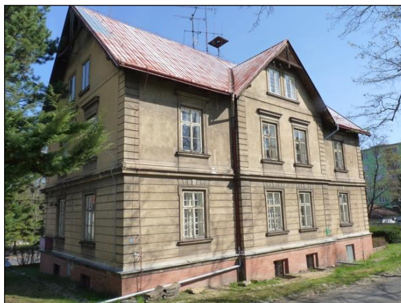
Bytový dům se sedlovou střechou