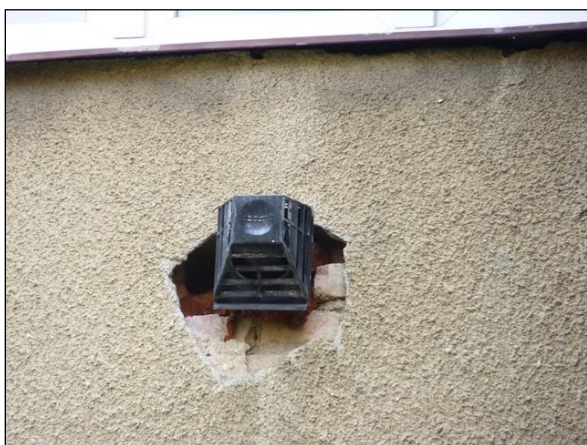
Nezačištěné okraje odvětrání podokenního topidla hnízdiště rojše obecného