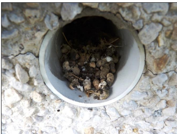
Trus rorýse obecného v ústí ventilačního otvoru