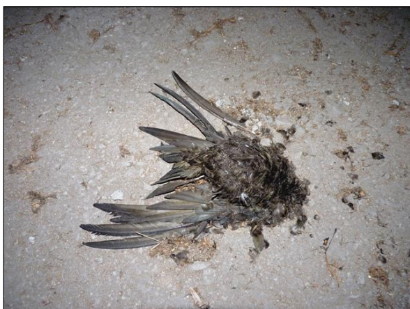
Uhynulý rorýs na podlaze půdy