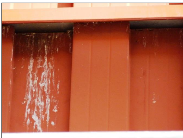
Prostor pod vletovým otvorem pěvců je často znečištěn trusem