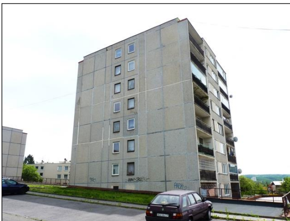
Panelový bytový dům