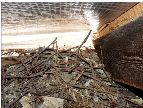
Hnízdo kavky se skládá z hrubšího materiálu, převážně větviček dřevin rostoucích v okolí