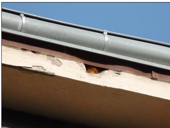
Detail poškození římsy – vletový otvor do hnízda