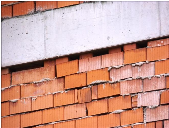
Poškození neomítnutého zdiva – obvyklý, úkryt ptáků i netopýrů