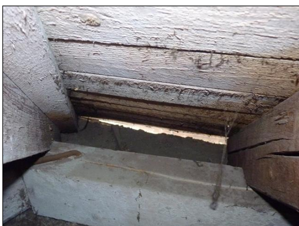
Prostor za pozednicí – nejčastější hnízdiště synantropních ptáků