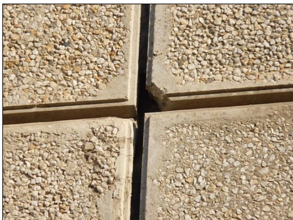
Volné spáry mezi panely