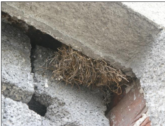
Hnízda vrbců obsahují velké množství hnízdního materiálu