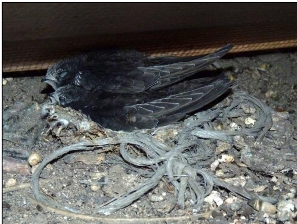
Hnízdo rorýse obecného s mláďaty